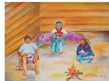
Calentura, escalofríos y dolor abajo del vientre