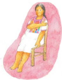
Hinchazón en las manos, la cara y los pies