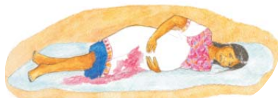
Pérdida de sangre con o sin dolor