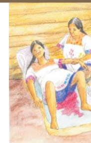
Excesiva pérdida de sangre