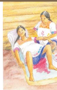
Excesiva pérdida de sangre