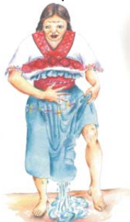
Sale agua por la parte de la mujer