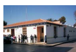
Hospital Regional de San Cristóbal de Las Casas, Chiapas, entrada del área de Urgencias.