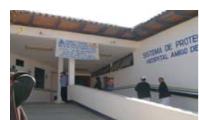
Hospital Regional de San Cristóbal de Las Casas, Chiapas entrada principal, Avenida Insurgentes.

EN DONDE Y QUIENES DEBEN ATENDERTE CUANDO PRESENTAS PROBLEMAS DURANTE EL EMBARAZO, EL PARTO Y DESPUÉS DE QUE NACE EL BEBE