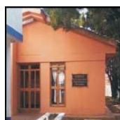
Albergue de la Jurisdicción Sanitaria II