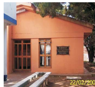
Albergue San Cristóbal de Las Casas.