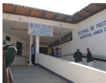
Hospital Regional, entrada principal, Avenida Insurgentes San Cristóbal de las Casas.

EN DONDE Y QUIENES DEBEN ATENDERTE CUANDO PRESENTAS PROBLEMAS DURANTE EL EMBARAZO, EL PARTO Y DESPUÉS DE QUE NACE EL BEBE