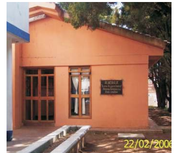
Albergue San Cristóbal de Las Casas.