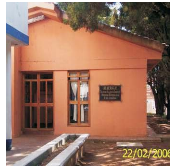
Albergue San cristóbal de las casas.