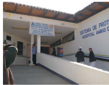
Hospital Regional, entrada principal, Avenida Insurgentes San Cristóbal de las Casas.

EN DONDE Y QUIENES DEBEN ATENDERTE CUANDO PRESENTAS PROBLEMAS DURANTE EL EMBARAZO, EL PARTO Y DESPUÉS DE QUE NACE EL BEBE