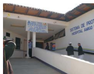
Hospital Regional, entrada principal, Avenida Insurgentes San Cristóbal de las Casas.

EN DONDE Y QUIENES DEBEN ATENDERTE CUANDO PRESENTAS PROBLEMAS DURANTE EL EMBARAZO, EL PARTO Y DESPUÉS DE QUE NACE EL BEBE