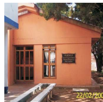
Albergue San cristóbal de las casas.