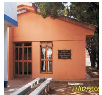
Albergue San cristóbal de las casas.