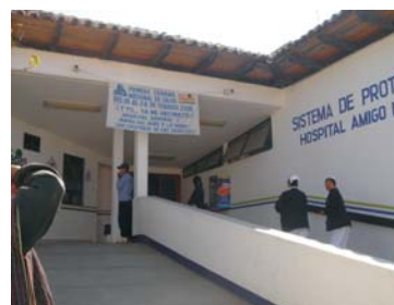
Hospital Regional, entrada principal, Avenida Insurgentes San Cristóbal de las Casas.

EN DONDE Y QUIENES DEBEN ATENDERTE CUANDO PRESENTAS PROBLEMAS DURANTE EL EMBARAZO, EL PARTO Y DESPUÉS DE QUE NACE EL BEBE