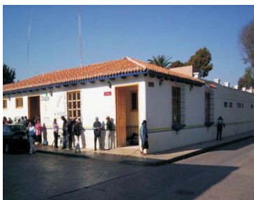
Hospital Regional, entrada de Urgencia. San Cristóbal de las Casas.