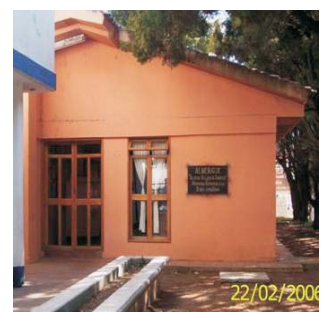
Albergue San cristóbal de las casas.