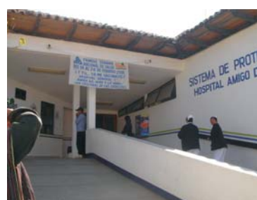
Hospital Regional, entrada principal, Avenida Insurgentes San Cristóbal de las Casas.

EN DONDE Y QUIENES DEBEN ATENDERTE CUANDO PRESENTAS PROBLEMAS DURANTE EL EMBARAZO, EL PARTO Y DESPUÉS DE QUE NACE EL BEBE