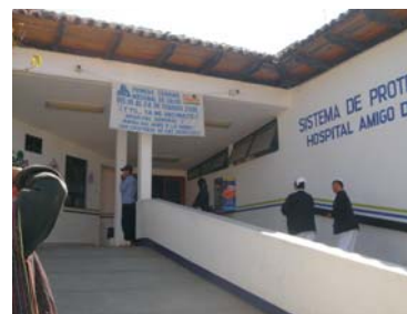
Hospital Regional, entrada principal, Avenida Insurgentes San Cristóbal de las Casas.

EN DONDE Y QUIENES DEBEN ATENDERTE CUANDO PRESENTAS PROBLEMAS DURANTE EL EMBARAZO, EL PARTO Y DESPUÉS DE QUE NACE EL BEBE