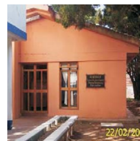
Albergue San cristóbal de las casas.