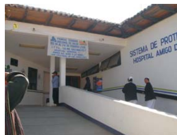
Hospital Regional, entrada principal, Avenida Insurgentes San Cristóbal de las Casas.

EN DONDE Y QUIENES DEBEN ATENDERTE CUANDO PRESENTAS PROBLEMAS DURANTE EL EMBARAZO, EL PARTO Y DESPUÉS DE QUE NACE EL BEBE